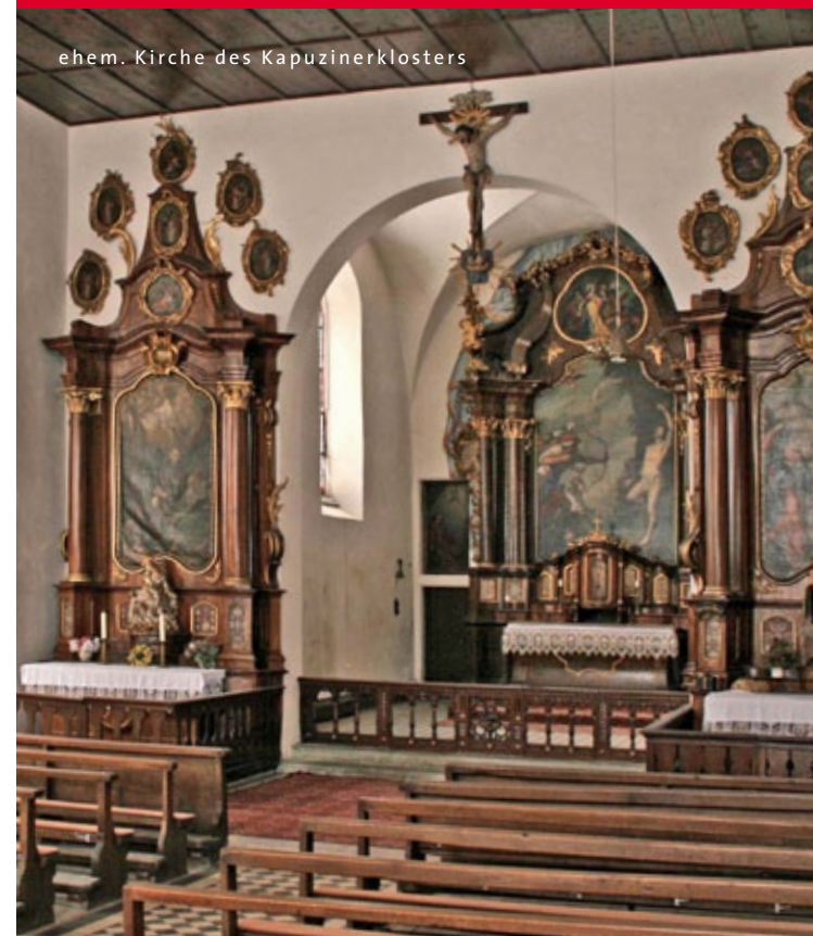
ehem. Kirche des Kapuzinerklosters