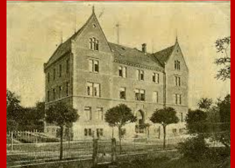
Schülerwohnheim Josefinum, errichtet 1914 – genannt „Kästen“. 2010 Neubau: Franz-von-Sales-Realschule für Jungen in kirchlicher Trägerschaft

Studientag mit Jahresversammlung im ehem. Franziskanerkloster, Spitalstraße 30, 89584 Ehingen