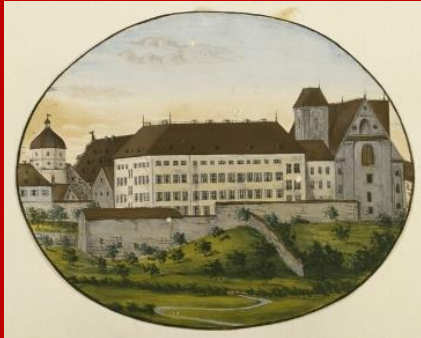
Benediktinerkolleg 1706-1803. 1825 kgl. württ. Konvikt. 1883 Oberstufe des Gymnasiums, seit 1934 bischöfl. Konvikt, nach Neubau als „Altes Konvikt“ bezeichnet