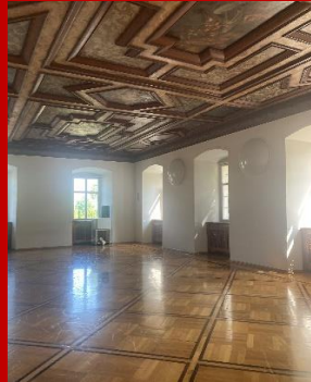
Refektorium im Benediktinerkolleg, heute städtische „Grundschule Altes Konvikt“